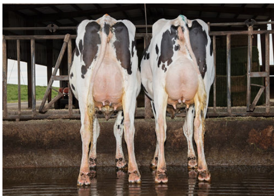
BOSA DAUGHTER GROUP DAUGHTER