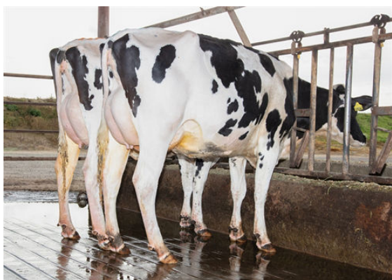
BOSA DAUGHTER GROUP DAUGHTER